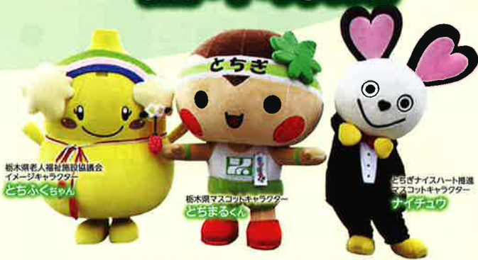
栃木県老人福祉施設協議会 イメージキャラクター どちくちゃん