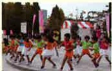
(福)聖会バンビニーとよさとの園児