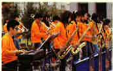
うつのみやジュニアジャズオーケストラ